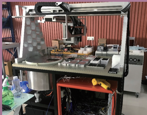
仪器 plus 机内部实物图