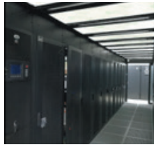
北京地理数据计算模拟中心