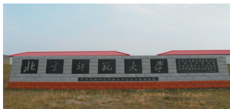
内蒙古太仆寺旗野外试验站