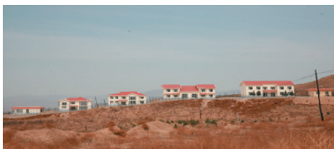
河北怀来综合实验基地