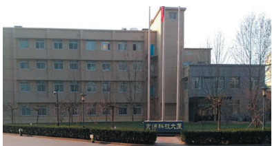
北京分析测试中心

北京师范大学地表过程与资源生态国家重点实验室（ESPRE）于2007年10月通过建设计划论证，经科学技术部批准开始建设，并于2010年12月正式验收。ESPRE以北方农牧交错带、海陆过渡带和城乡过渡带为基地，通过打造优质野外监测平台、室内分析测试平台和数据计算模拟平台，从地表过程、资源生态、地表系统模型与模拟、区域可持续发展四大研究方向系统开展国际地球系统科学前沿问题研究，发展以地理学和生态学为基础的人-地系统动力学，创建以大型地表过程模拟装备和典型资源生态系统实验基地为支撑的国内领先、国际一流的区域地理系统研究基地。2019年，ESPRE依托北京师范大学珠海校区成立珠海基地，通过在地表过程与灾害风险、三角洲和海岸带水土保持与生态安全、粤港澳大湾区土地利用和韧性城市群等方向开展实验、模拟和对策研究，服务于粤港澳大湾区绿色发展与生态文明建设。