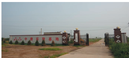
河北黄骅海岸带资源与风险研究基地