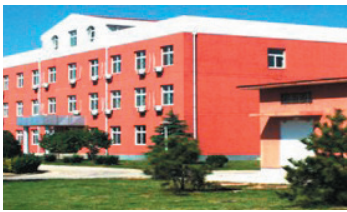
北京房山综合实验模拟基地