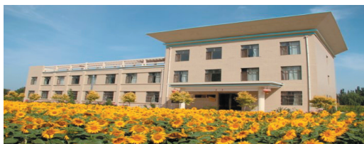
黑河流域地表过程综合观测基地