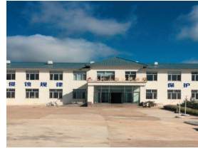
黑龙江鹤山九三水水土保持试验站