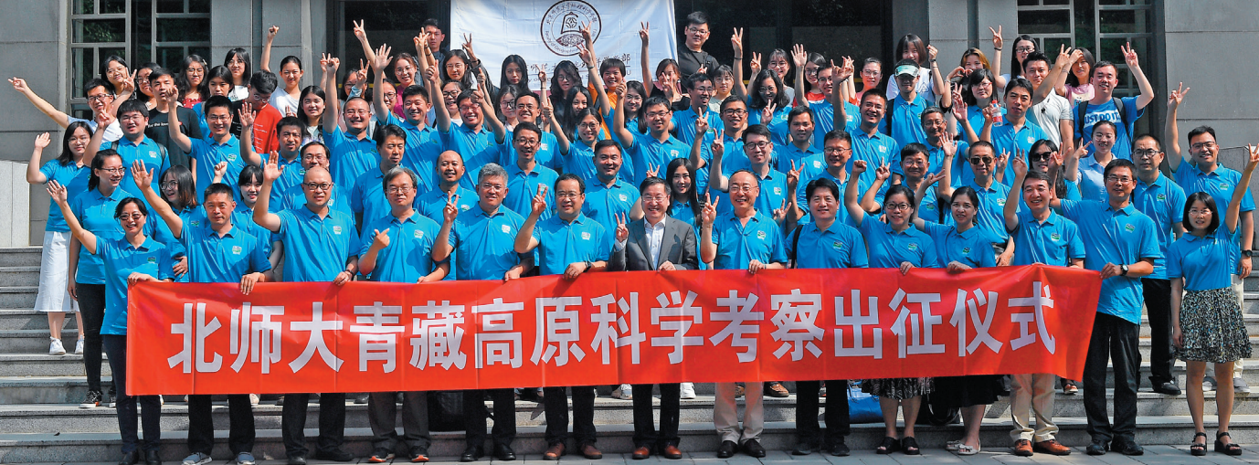
北京师范大学2019年第二次青藏高原综合科学考察出征仪式

北京师范大学地表过程与资源生态国家重点实验室（ESPRE）于2007年10月通过建设计划论证，经科学技术部批准开始建设，并于2010年12月正式验收。ESPRE以北方农牧交错带、海陆过渡带和城乡过渡带为基地，通过打造优质野外监测平台、室内分析测试平台和数据计算模拟平台，从地表过程、资源生态、地表系统模型与模拟、区域可持续发展四大研究方向系统开展国际地球系统科学前沿问题研究，发展以地理学和生态学为基础的人-地系统动力学，创建以大型地表过程模拟装备和典型资源生态系统实验基地为支撑的国内领先、国际一流的区域地理系统研究基地。2019年，ESPRE依托北京师范大学珠海校区成立珠海基地，通过在地表过程与灾害风险、三角洲和海岸带水土保持与生态安全、粤港澳大湾区土地利用和韧性城市群等方向开展实验、模拟和对策研究，服务于粤港澳大湾区绿色发展与生态文明建设。