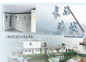
长江三峡库区秭归新城庙河水水质自动监测站