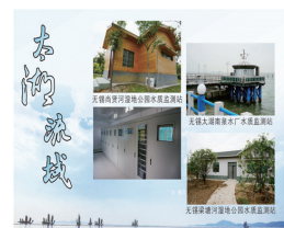
无锡尚贤河、梁塘河湿地公园，太湖南泉水厂水质自动监测站