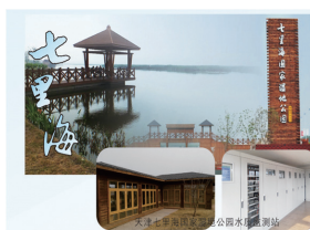
天津七里海湿地公园水质自动监测站