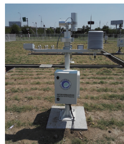
北京国家基本气象站（北京市气象台）