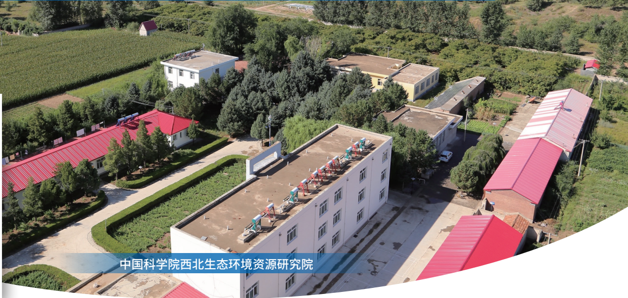
中国科学院西北生态环境资源研究院