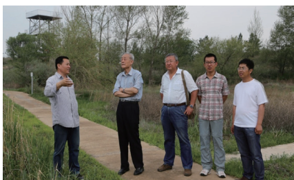
2016年，中国科学院原副院长、中国科学院院士孙鸿烈来奈曼站考察和指导