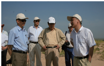
2008年，中国科学院副院长、中国科学院院士丁仲礼视察奈曼站