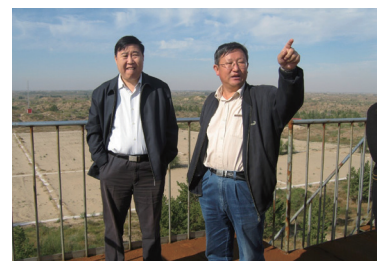
2014年，中国科学院院士傅伯杰来奈曼站考察和指导