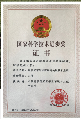
2018年国家科技进步奖二等奖