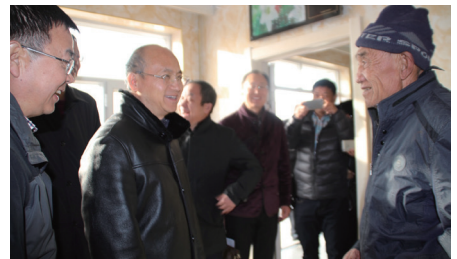
2017年，中国科学院副院长、中国科学院院士张亚平调研奈曼站科技扶贫工作