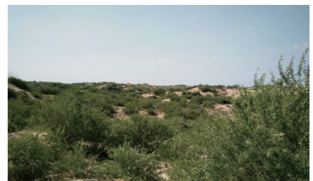
沙区退化植被持续稳定恢复技术