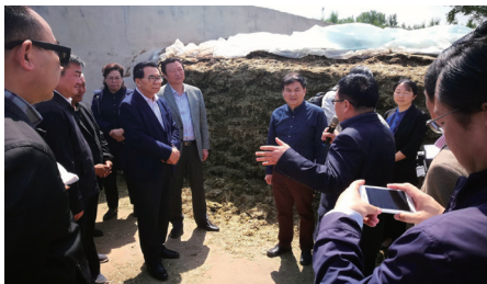
2018年，中国科学院院长、中国科学院院士白春礼调研奈曼站科技扶贫工作