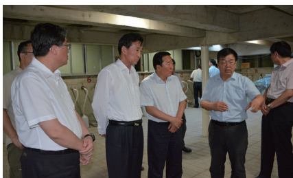
2016年，时任内蒙古自治区党委常委、纪委书记张力等调研奈曼站