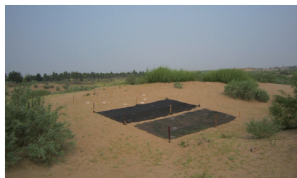
有机混合物诱导土壤生物结皮快速生成技术