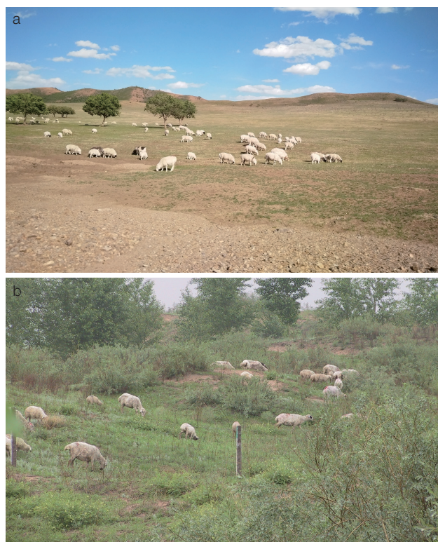
图2 牧压梯度实验（研究放牧压力对半干旱草地的影响，确定合理牧压梯度）

沙漠化不仅造成严重的土壤退化，而且直接导致植被结构和功能破坏。 通过研究沙漠化过程中沙区植被在群落、种群、个体、生理等各个层面的响应，发现沙漠化在群落层面上主要表现为物种丰富度、多度以及生产力的下降 [16] ，在种群层面表现为群落优势种群的更替 [17,18] ，在个体层面上表现为植物体内物质和能量分配格局的改变 [19-21] ，在生理层面上表现为细胞内物质含量和生理代谢过程的变化 [22,23] 。相关研究为科学认知固沙乔灌木维持固沙植被群落稳定的重要功能提供理论支持。沙漠化对植物最直接的影响方式是沙埋和风沙流 [24,25] 。沙埋程度和风沙流强度对植物的存活和生长影响较大，但是沙区乡土植物可以通过提高体内抗氧化酶活力、渗透调节物质及净光合速率等来适应沙埋和风沙流 [24-27] 。综合沙漠化过程中植物种群、个体、生理特征的表现，将植物对沙漠化的响应分为敏感型、积极忍耐型、迟钝型3种类型，为风沙区重大生态工程建设的植物种类选择提供理论依据。