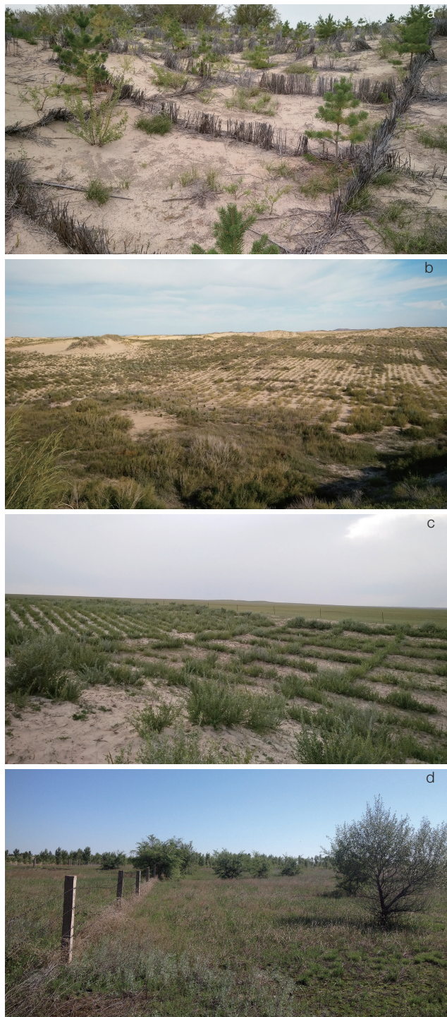
图1 半干旱区退化土地主要生态恢复措施

得到广泛应用，推动了防沙治沙和植被恢复重建工程的实施（图1）。根据遥感监测数据显示，2000年科尔沁沙地土地沙漠化发生根本性逆转，沙漠化治