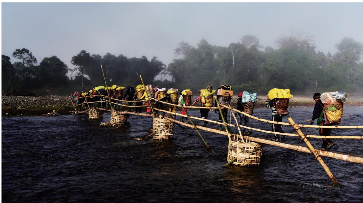
图2 中国科学院东南亚生物多样性研究中心在缅甸野外考察途中

生物多样性的自然分布总是跨越国界，不是集中分布于某一国家和地区，对全球生物多样性的认识和保护离不开各国科学家的紧密合作。科研合作将进一步增加与相关国家和地区的国际合作研究，尤其是国际区域的合作增加，为区域生物多样性研究和保护带来新的机遇。在“一带一路”倡议下，相关国家跨越东南亚、中亚、西亚、大洋洲、北美、南美、东欧和中欧等地区，涉及131个国家 ④ 。与相关国家和地区展开生物多样性联合研究将为全球生物多样性保护提供契机。“一带一路”沿线的许多国家和地区，尤其是经济欠发达国家和地区，对生物资源的过度开发和利用对地区生物多样性造成了严重的破坏，生物多样性方面的研究与保护与欧美发达国家相较还是薄弱。通