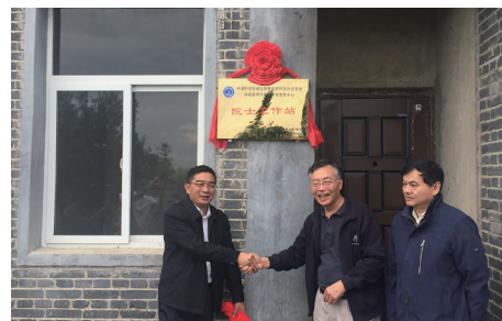
水城县院士工作站