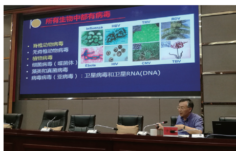
方荣祥院士在水城县进行技术讲座