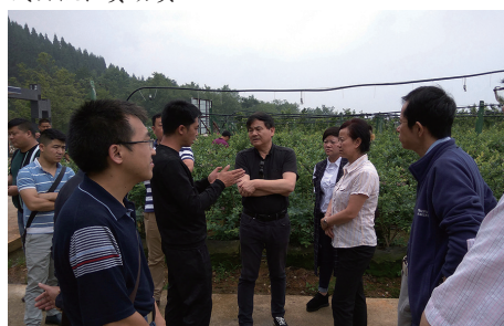
科技扶贫团队在六盘水地区实地调研