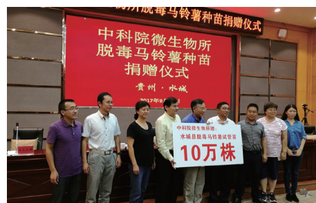
中国科学院微生物研究所向水城县无偿捐赠10万株马铃薯脱毒试管苗