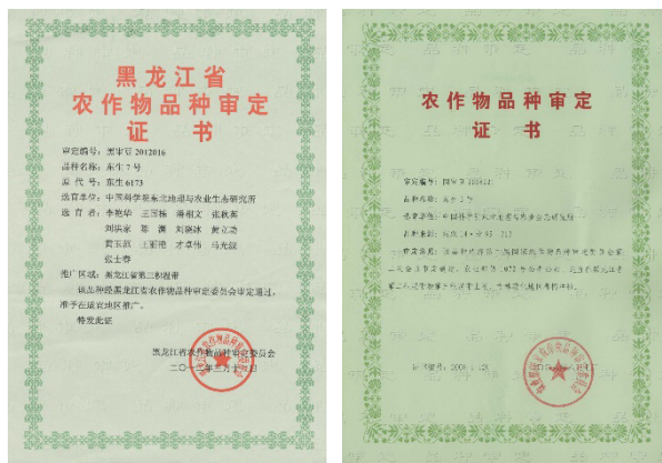
图3 “东生号”系列大豆品种审定证书

根据长期野外观测和田间长期定位试验，获得了黑土退化实质是基于侵蚀导致黑土层变薄和非侵蚀耕地基于高强度利用导致耕作层变浅，有机质变少，犁底层变厚、变硬的问题，首次提出并建立了肥沃耕层理论。根据作物高产根系生长发育需要的土壤空间、大气降水特征和土壤类型，首次建立了以培肥和改造0—35 cm土层为核心内容的肥沃耕层理论，即以农田耕层土壤扩容与培肥为目的，采用机械的方法，将能培肥土壤且无害化的农业生产废弃有机物深混于0—35 cm土层，形成一个深厚肥沃的耕作层（图4），构建了“水”“肥”“气”“热”相协调的土壤环境，能够促进作物根系生长和地上部发育，提高作物产