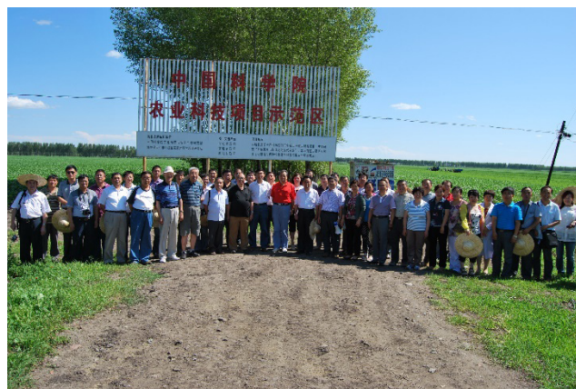
图 5 中国科学院农业科技项目示范区

豆轮作条件下分别建立了：④ 秸秆深混耕层扩容模式，⑤ 熟土心土混层二元补亏增肥模式，⑥ 黑土层、白浆层混合三元补亏调盈模式；玉米-大豆-大豆种植方式下分别建立了：⑦ 秸秆深混耕层扩容模式，⑧ 熟土、心土混层二元补亏增肥模式，⑨ 黑土层、白浆层混合三元补亏调盈模式。并以海伦市为核心示范县（图 5），其他 10 个县为扩展示范县，开展大面积推广应用，2006—2017 年累计示范推广面积 2 000 万亩，新增粮豆 7.8 亿千克，增收 19.1 亿元，全面提升了区域内黑土肥力和农业生产水平，研究成果过得了黑龙江省科技进步奖一等奖。