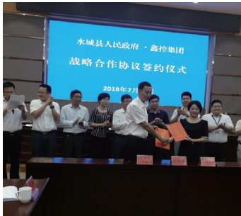
鑫控集团与水城县战略合作协议签约仪式