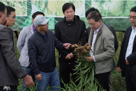
2018年10月，中国科学院党组副书记、副院长侯建国院士（右二）在水城县调研科技扶贫工作

贵州省六盘水市水城县为国家级贫困县，是中国科学院定点帮扶县。面对严峻的脱贫攻坚形势，中国科学院迎难而上，集中全院科技力量，充分发挥综合科技优势，结合水城县实际情况，重点培养贫困地区的自我造血功能，将科技扶贫与农村“三变”改革相融合，完成脱贫攻坚目标。在深入调研的基础上，因地制宜开展了 13 项科技扶贫项目，覆盖水城县主要扶贫产业，涉及农业、工业、生态、旅游、教育等多个领域。通过科技扶贫促进扶贫产业的快速发展，不断延伸产业链，提升附加值，带动贫困人群增产增收、扩大就业渠道，实现精准脱贫；强调“扶贫先扶智”，发挥中国科学院人才优势，加强地方人才培养；突出生态建设与脱贫攻坚相结合，乡村振兴战略与精准扶贫相融合，走可持续发展之路。