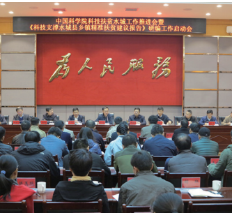
2017年3月21日，《科技支撑水城县乡镇精准扶贫建议报告》研编工作启动