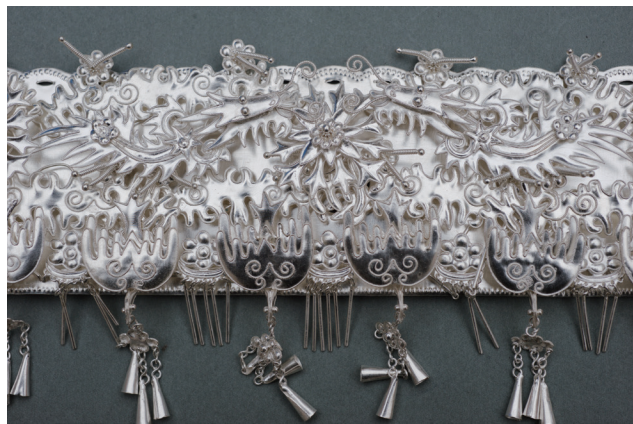
中国传统金银细金工艺制品

从1996年启动到1999年全面展开，再到2006年，10年间，《全集》第一辑的14卷13册：《漆艺》《陶瓷》《金银细金工艺和景泰蓝》《造纸与印刷》（两卷合成一册）《中药炮制》《传统机械调查研究》《雕塑》《金属工艺》《丝绸织染》《民间手工艺》《文物修复和辨伪》《酿造》和《历代工艺名家》相继完稿；经执行主编审阅、退改和定稿后，交出版社编校，于2004—2008年陆续出版。其时，恰逢非遗保护工作在我国全面铺开，因传统工艺作为非遗的重要组成部分，占有1/4的体量，社会各界迫切希望了解它的内涵和价值，且《全集》的《造纸与印刷》《丝绸织染》《陶瓷》《漆艺》等卷也为有关工艺申报国家级非遗名录提供了权威性的科学依据，因而这套书受到广泛的欢迎。2006年，《全集》首批7卷荣获原新闻出版总署优秀出版物大奖——首届中华优秀出版物奖。评审委员会的评语称：“此项研究具有极高的学术价值和历史价值，为维护中国的文化命脉和保持民族精神特质作出了贡献，对相关学科的发展也将起到推动作用。”