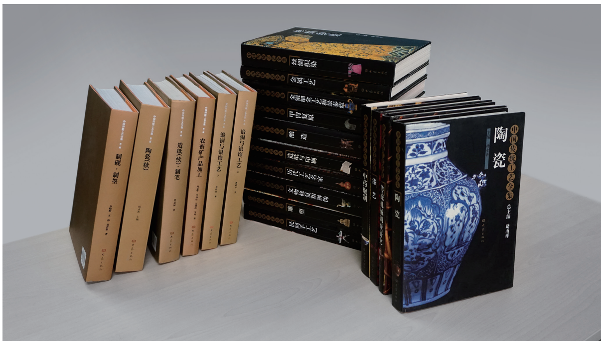
《中国传统工艺全集》

性研究，走访了费孝通、钱临照、袁翰青、王世襄、李学勤、席泽宗等著名学者，制订了《中国传统工艺保护开发实施方案》，并于1988年底上报。但由于当时有关部门无心顾及此事，最终不了了之。