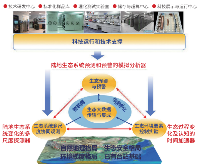
图3 生态大科学工程: 中国陆地生态系统观测试验网络(CEOBEX)概念设计

(1) 在数据开放共享基础上,积极推动生态数据整合挖掘研究。我国在生态系统结构和功能等方面进行了长期观测和研究,积累了大量数据。例如:CERN收集了我国不同生态系统的长期观测实验数据,中国陆地生态系统通量观测研究网络(ChinaFLUX)进行了长达15年的碳水通量监测;“地球科学大数据工程”的实施,提供了先进的大数据整合挖掘手段,为开展全国尺度的生态系统结构、功能、过程以及重大科学问题的综合集成研究奠定了基础。