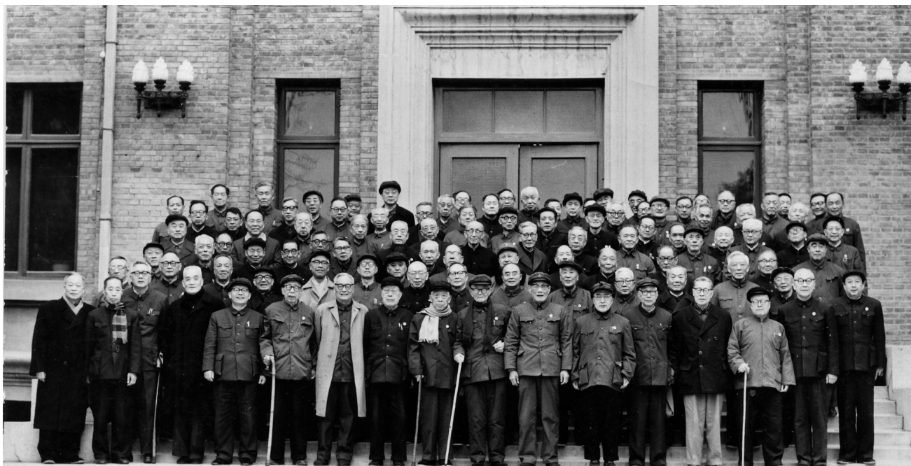
图6 全国科学大会期间，与会的中科院学部委员与中科院领导在友谊宾馆科学会堂前合影

一切民族、一切国家的长处都要学，政治、经济、军事、科学、技术、文学、艺术的一切真正好的东西都要学。我们是在独立自主、自力更生的基础上，有分析、有批判地向外国学习。……如果真的不分青红皂白，一概拒绝向外国学习，其结果，就只能使中国永远处于落后地位，哪里还谈得上社会主义现代化？” [3]