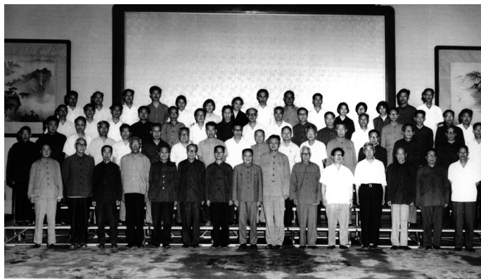
图1 科教工作座谈会与会者合影