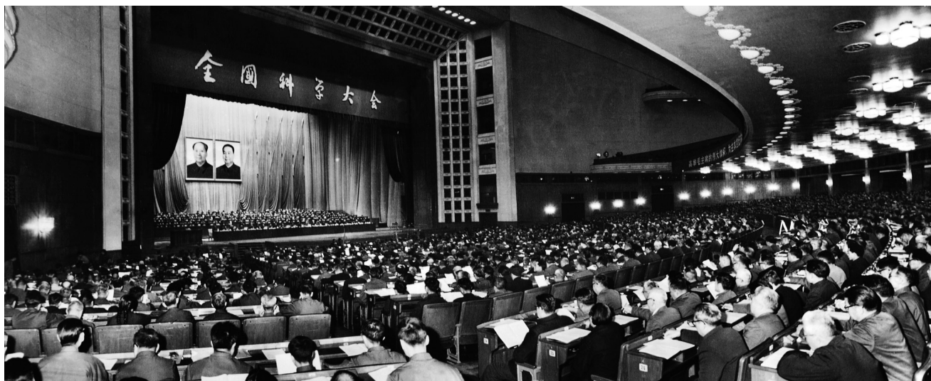
图4 全国科学大会会场