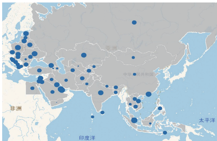
图3 “一带一路”沿线国家或地区的“普遍信任”分布情况 图中蓝点的面积表示普遍信任原始分归一化后的分布指数大小,面积越大则普遍信任越高

特殊信任的分数。将 WVS 包含的“一带一路”国家或地区数据与预测得到的结果进行整合,从而得到“一带一路”沿线国家或地区的普遍信任和特殊信任分数,其分布情况如图 3 和 4,具体得分详见电子版附表 2。