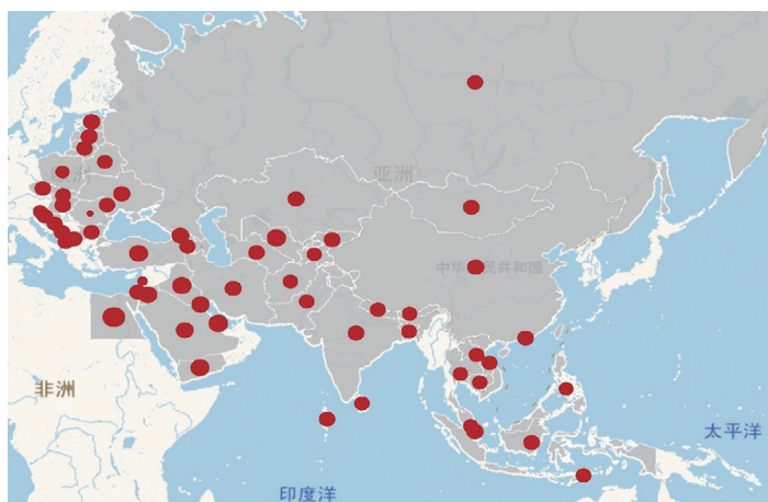
图4 “一带一路”沿线国家或地区的“特殊信任”分布情况 图中红点的面积表示特殊信任原始分归一化后的指数大小,面积越大则特殊信任越高