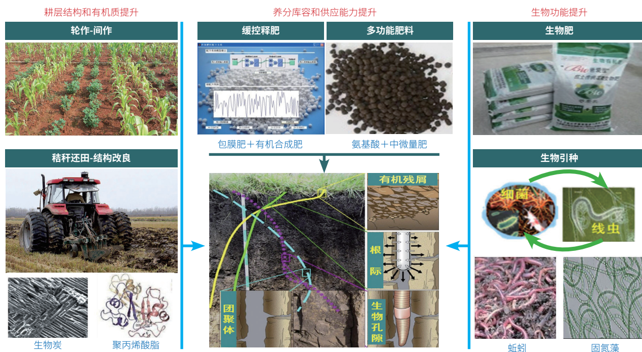
图1 建立“有机质-养分库-生物功能”协同提升的肥沃耕层构建理论和耕地保育技术模式

国内基于作物高效利用雨水和灌溉水的机制，发展了降水保蓄和灌溉水高效利用的统筹方法，研发了不同区域节水抗旱品种、覆膜集雨保墒和秸秆还田培肥聚墒技术，形成了“集、蓄、保、提”旱地农业丰产节水技术体系、集雨补灌技术、分根交替灌溉和调亏灌溉技术、水肥耦合技术、化学制剂应用技术、水肥一体化微灌节水技术；通过集成农艺和工程节水技术，实现了生物和化学节水、以水调水促肥、提高降水和灌溉水利用效率的目标。在挖掘中低产田弱水资源利用特别是咸水和微咸水利用方面，研发了基于土壤-水-盐-作物相互关系的微咸水补灌制度，基于咸