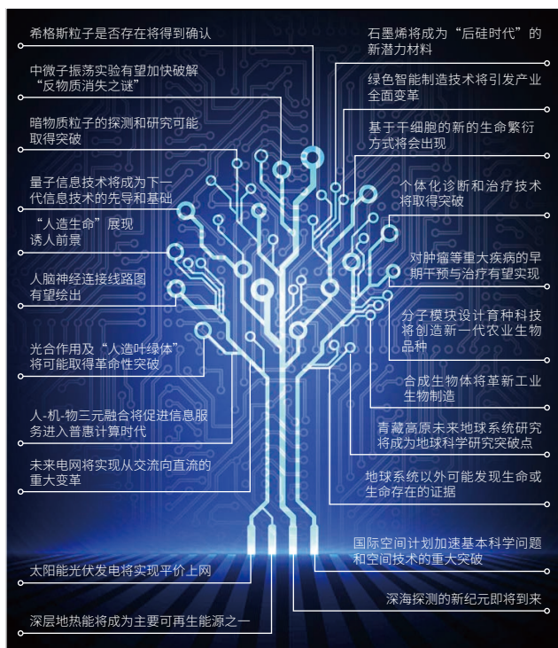
图2 2013年中科院预测近中期世界可能发生的22个重大科技事件 ①