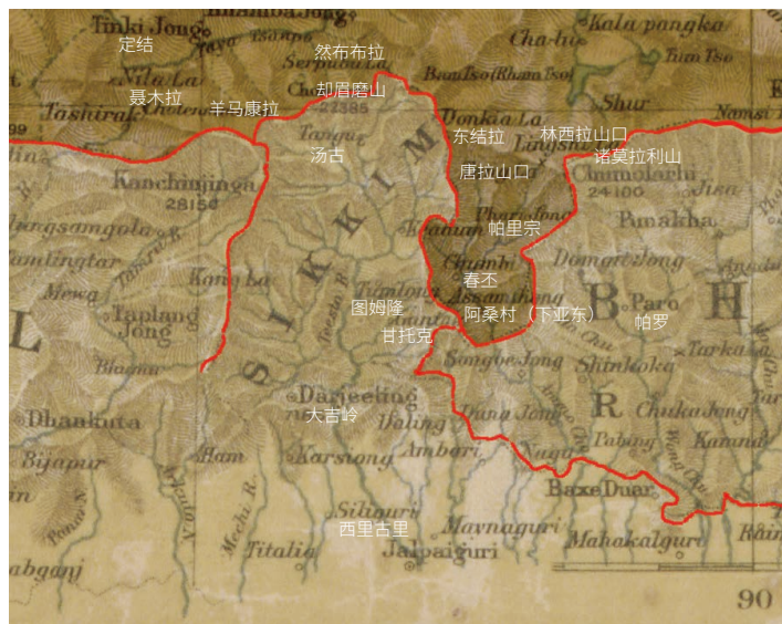
图3 1900年英国绘制的《西藏及其周边地区图》局部 [23]

1902—1904年发动第二次侵藏战争，甲岗等处领土经由《拉萨条约》而被割让给英国。对于20世纪初的亚东周边国界轮廓，英国1900年出版的《西藏及其周边地区地图》（图3） [23] 有较好的图示。之后的30多年内，亚东段国界在整体上较之现今没有大的差异。2017年6—8月中印两军对峙的洞朗地区，赫然位于中国境内。