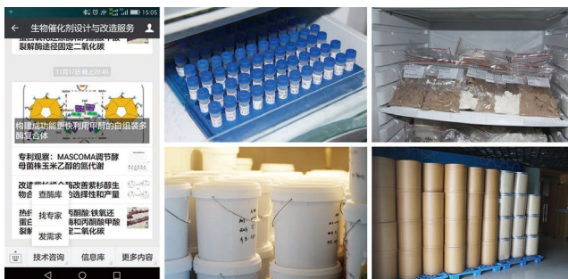
为企业定制各类生物催化酶制剂

该团队突破了国内医药化工企业难以得到生物催化剂的瓶颈，12家企业应用该团队的定制酶近3年新增销售额20.05亿元，累计78.73亿元。酶法替代化学合成工艺后降低了普药的生产成本，并具节能减排的效果，DL-丙氨酸酶法工艺每年减少的二氧化碳相当于234辆家用汽车的排放量。