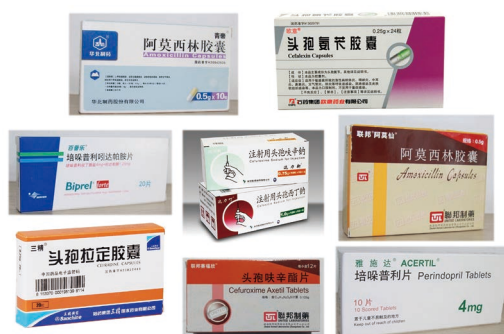
定制酶生产中间体最终用于各种药品