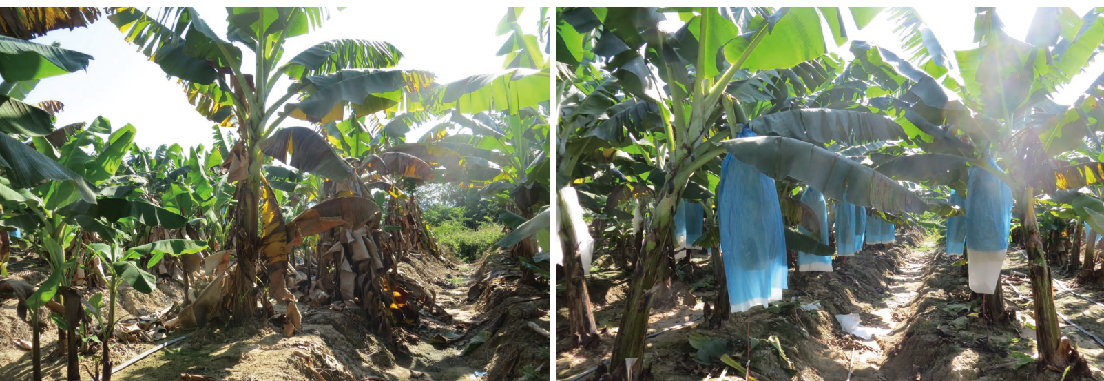
图1 香蕉枯萎病（左，对照）及强还原土壤处理治理香蕉枯萎病的效果（右，强还原土壤处理）（海南乐东，2014年）

甸、老挝等东南亚国家转移。云南省2005年开始大面积种植香蕉，每年以6千多公顷的速度迅速扩张。据不完全统计，云南全省香蕉种植面积约9.3万公顷，主要分布在红河、西双版纳、普洱等滇南地区。西双版纳香蕉主产区勐海打洛镇、勐腊县勐捧一带、景洪大勐龙一带最先开始暴发黄叶病，如今，一半左右的地区已经不能再种植香蕉。香蕉种植开始向高海拔区发展 [6] 。由于香蕉生长需要较高的温度，适宜种植的气候和土壤区域有限，长此以往，香蕉生产将面临无地可种的境地。再如洋桔梗，作为一种新型鲜切花，2015年洋桔梗在我国云南种植面积已达350公顷，替代非洲菊成为云南第四大鲜切花 [7] 。在种植面积不断扩大的同时，洋桔梗正遭受由尖孢镰刀菌洋桔梗专化型（ F. oxysporum f. sp. eustomae ）所引起的枯萎病的严重侵害（图2）。据笔者了解，在连续种植3年后，2014年云南一花卉果蔬有限公司13.9公顷洋桔梗的枯萎病发病率平均达40%以上。黄瓜、番茄、青椒等大众蔬菜的种植也普遍遭受土传病害的侵袭，导致这些农产品的产量不稳，市场动荡，前景堪忧 [8] 。土传病害不只发生在瓜果、花卉、蔬菜等经济作物，而且也发生在水稻、马铃薯、大豆、花生等大田作物 [9] 。2007年我国水稻纹枯病发病面积已达1718万公顷 [10] 。我国马铃薯种植面积逐年上升，从2008年的466.33万公顷增至2013年