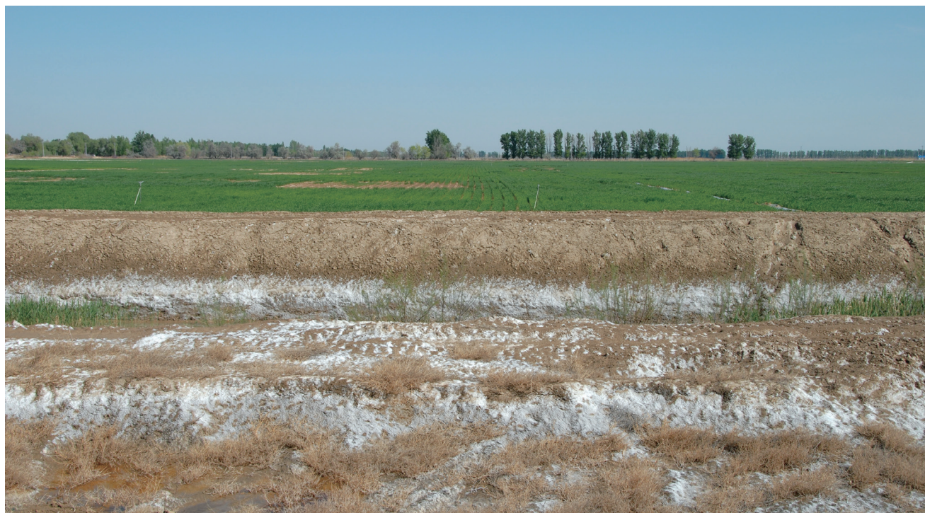
图 2 盐渍化是绿洲农业永远的威胁

绿洲农田防护林退化有两个方面的原因：（1）许多防护林是 20 世纪 80 年代营造的，主要树种是杨树，目前已经整体老化；（2）随着渠道全面防渗和农田高效节水灌溉技术的普遍推广应用，灌区地下水位持续下降，使得原来主要依靠灌溉回归水和渠系渗漏水维持的农田防护林出现了衰退死亡 [26] 。绿洲农田防护林不仅有调节农