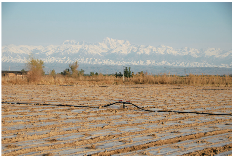
图1 兵团拥有全国最发达的节水农业