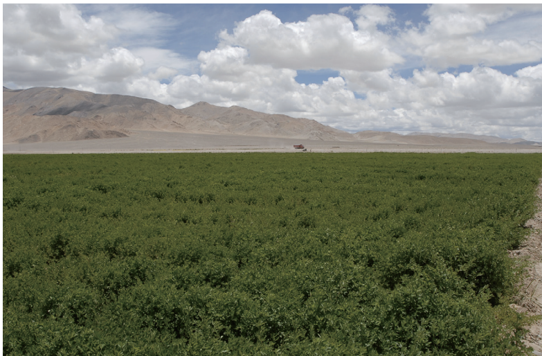
图3 西藏阿里地区人工草地工程