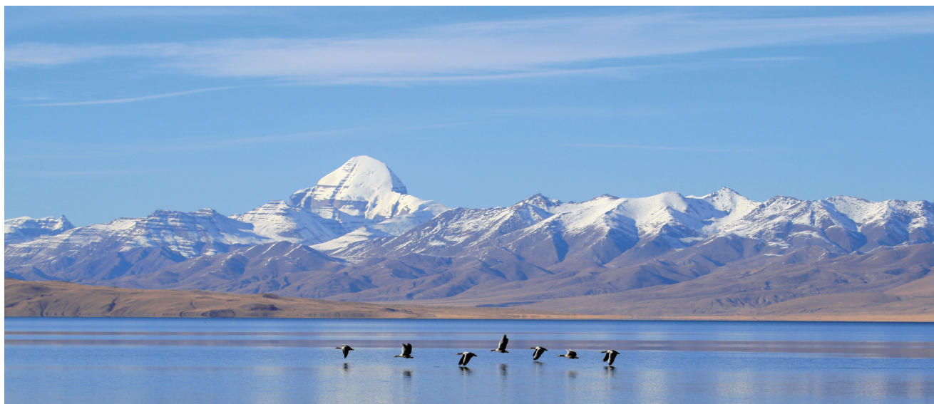
图 4 玛旁雍错湿地保护成效显著

（1）生态系统水源调节作用波动中提升，森林涵养水源功能稳固保持。全区森林、草地和湿地生态系统的年水源涵养量为 916.2 亿 \text{m}^3 ，单位面积水源涵养量为 750 \text{m}^3/\text{hm}^2 ，工程实施后增加了 2.65%。