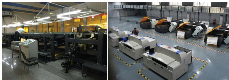
图3 世界首条纳米绿色版基示范线（左）与绿色制版中心（右）局部图

（4）纳米绿色印刷制造技术的拓展。突破传统电路蚀刻制造工艺，成功研发出绿色、低成本的纳米绿色印刷电子技术，并主持相关国际标准的制定；印制的电子票卡在全国科技活动周、APEC会议和地铁票卡等市场成功应用。