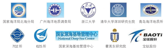
图4 参加海斗深渊先导专项的中科院外单位