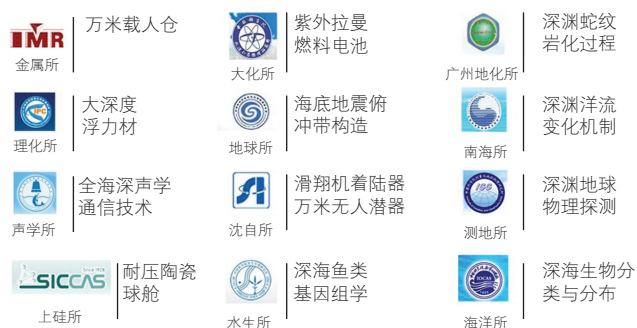
图3 参加海斗深渊先导专项的中科院内单位

两年多时间里,除了海洋所、南海海洋所、声学所、沈阳自动化所等原本涉海的研究所,金属所、大连化学物理所、上海硅酸盐所、测量与地球物理所、地质与地球物理所、水生生物所等原未涉及海洋技术研究的团队也在专项中也发挥了重要作用。目前,除深海所外,参加海斗深渊先导专项的中科院团队已达12家(图3),高校、企业及部门院所也达10家(图4)。