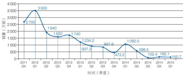
图2 iPhone 4s 全球销量

如图2所示, iPhone 4s 手机销量在 500 万部以上的生命周期平均约为 2—2.5 年,但是从 2012 年 3 季度到 2016 年 3 季度的 4 年期间,苹果又发布 7 型和即将发布的 1 型共 8 种,平均生命周期只有 0.6 年,这比实际可用的平均生命周期短 1.9—2.0 年,平均缩短 73%,这必然造成能源、原材料和人力的浪费,同时引发有关的生态环境应力。