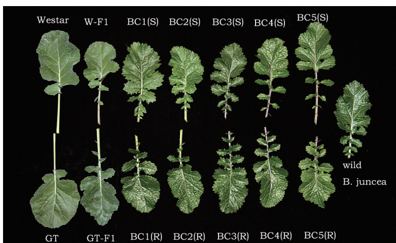
图1 栽培油菜（最左第1列，Westar 和 GT）与野生芥菜（wild Brassica juncea ，最右）的杂交种（F1）和回交后代（BC1—BC5）的叶片形状逐步趋向其母本野生芥菜。Westar：非转基因油菜亲本品种；GT：转基因油菜；W-F1：非转基因亲本 Westar 与野生芥菜的杂交种；GT-F1：转基因油菜与野生芥菜的杂交种；S：不携带转基因的回交后代（不抗虫）；R：携带转基因的回交后代（抗虫）

并不一定带来适合度代价 [21-23] ；而在某些条件下，转基因在杂回交后代的表达还能提高植物的适合度 [24,25] 。Cao 等人 [26] 研究发现，转基因抗虫油菜与野生芥菜（ B. juncea ）的杂回交后代中转基因能够正常表达，具有跟转基因油菜亲本同样的杀虫活性，而且其形态也逐渐接近野生亲本（图1），不易与野生亲本区分，转基因与其野生近缘种间杂交种的命运需要长期的监测研究。