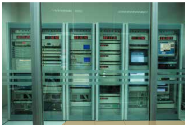
时间基准保持系统

1979 年 10 月建成我国相对独立的原子时系统，完成了我国天文时向原子时的过度，1981 年 1 月正式加