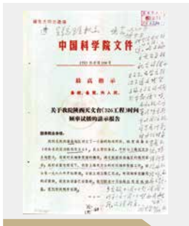
周恩来总理批准播