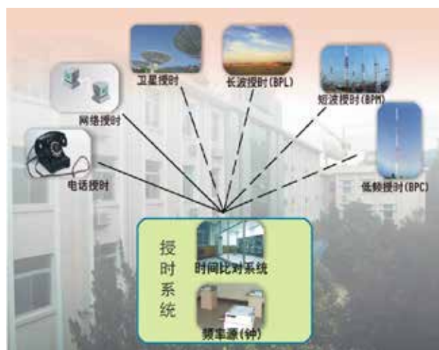
国家授时中心形成的多手段授时体系

同时，国家授时中心面向国家时频体系建设和卫星导航系统建设重大需求，在时间频率和卫星导航领域开展科学研究工作，发挥科技的支撑和引领作用。目前，除授时运行维护队伍外，有 200 余人专门从事科研工作，其中高级科技人员 80 名，拥有 3 个博士培养点和 5 个硕士培养点，一个博士后流动站，研究生教育规模达 150 人。国家授时中心在时间频率领域已逐步形成“频率源—守时—授时—应用”相对完整的研究体系，并在卫星导航领域得到快速发展，卫星导航信号体制、系统精密时间频率测量与控制、卫星精密测定轨等研究达到国际先进水平，在我国卫星导航系统建设中发挥了重要作用。