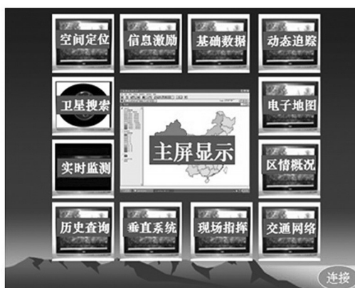
图3 社会稳定预警系统框架