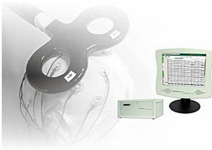
图1 经颅磁刺激方法(摘自Neuro Conn NEURO PRAXTMS)

另一方面,对大脑活动的选择性干预手段也在不断进步。除了传统的局部损毁、电刺激、微量药物注射外,也出现了经颅磁刺激(transcranial magnetic stimulation, TMS,图1)等方法 [11] 。有意思的是,遗传学研究的发展不仅为生理心理学实验对脑活动的所用干预提供了转基因(transgenic)和基因敲除(knockout)等被广泛使用的方法,也提供了高空间/时间分辨率和高神经元类别选择性的改变神经元兴奋状态的新方法。例如,光遗传学(optogenetics)就是利用遗传工程手段将某些对光敏感的藻类膜受体表达在特定的可兴奋细胞(如神经元)的膜表面上,随后用一定波长的光刺激来激活这些受体(图2),从而达到兴奋或抑制这些特定细胞的目的。在果蝇的运动神经元中表达了光敏感受体,通过不同波长的光来控制这些受体的开放,实现了对果蝇运动及运动方向控制的“遥控果蝇”的研究 [12] ,这曾在科学界引起了巨大的反响。在2006年,“光遗传学(optogenetics)”的