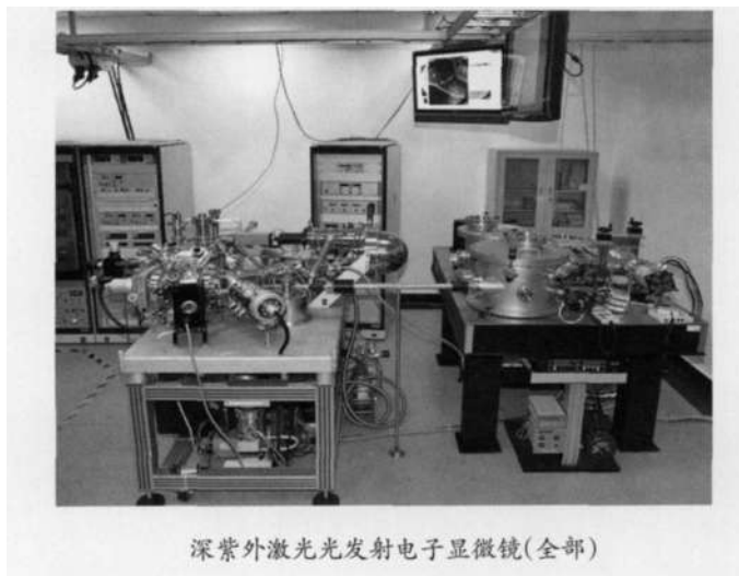
深紫外激光光发射电子显微镜(全部)