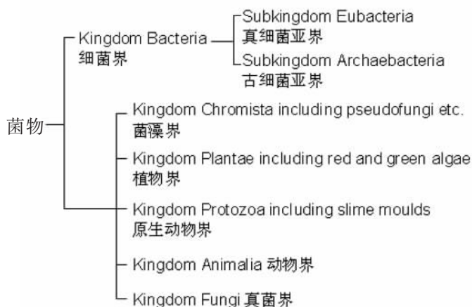
图1 生物六界系统 [1]

按照这一保守估计,作为世界生物多样性最丰富的国家之一,我国已知维管束植物按3万种计,寄生和内生真菌至少有30万种。如果将土壤腐生真菌以及附生在植物茎叶上的附生真菌( phorophytic fungi )和生长在岩石上的地衣型和非地衣型真菌以及地衣内生菌估计在内,必将远远