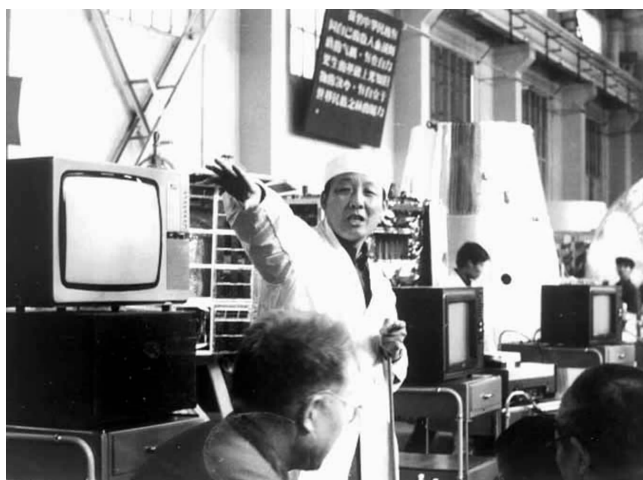
上世纪 70 年代孙家栋在卫星研制现场领导研制工作