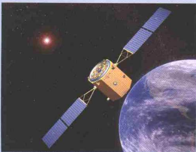
▲空间硬X射线调制望远镜示意图