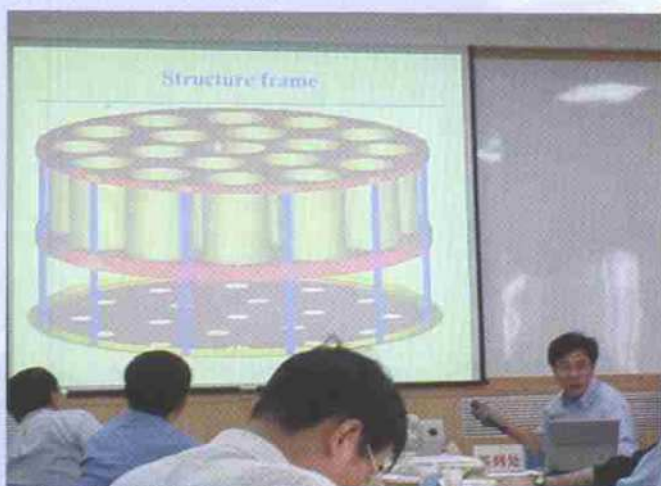
▲望远镜18个准直器安装结构图