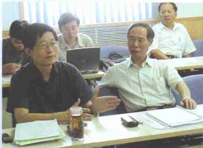
▲首席科学家李惕碚院士(前左)在向参加中期评估的专家介绍项目进展情况