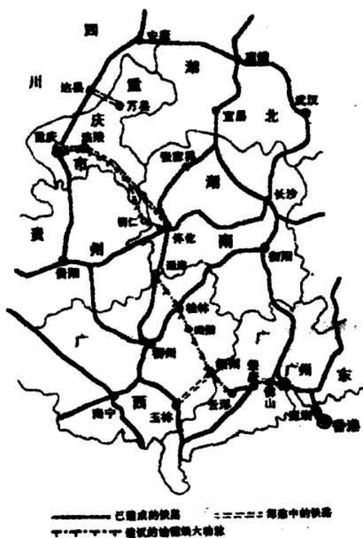
图3. 建设新建的渝昆铁路大动脉示意图

修建重庆到怀化的铁路只是打通重庆出海口的第一步,并不能根本解决重庆走向世界的问题,尚需在重庆和广州之间建立最短的“大陆桥”。这就必须由国家统一规划,建设一条新的铁路大动脉。广西已经注意到梧州的发展问题,即将动工兴建玉林到梧州的铁路。梧州到钦州和北海的铁路迟早也要修,这两段铁路平行南流江和北流江,工程量不大,从有效利用北海港的角度出发也势在必行。粤桂两省“唇齿相依”,一荣俱荣,粤桂联姻贵在梧州,不言而喻,用铁路连通梧州和云浮是两省共同利益之所在。而从广西城市的合理布局而言,发展梧州是广西一着必走的棋。现在问题是,梧州要通北京,是与柳州接轨,还是与桂林接轨?从经济效益和工程量来看,都是与桂林接轨更有利。梧州这着棋走好了,再回过头来看怀化的棋如何走,显然应从怀化市的通道县经广西的龙胜县到桂林接通铁路。这条铁路从头到尾就是重庆—怀化—桂林—梧州—肇庆—广州的铁路大动脉(图3),全长约1400公里。它使重庆到广州的距离缩短1/3,其中要动的工程大约是1000公里,是全国性的大项目。如果重庆到怀化段通过贵州的铜仁市,那么动员重庆、湖南、广西、广东还包括贵州五省市资金,加上中央的财政支持,并且可以吸收外资,财力上是可行的。这条大动脉的意义显然不亚于京九线,重庆走向世界需要它,中华民族大团结需要它。