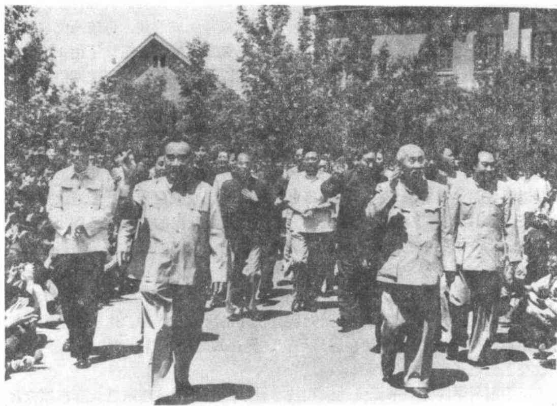
朱德、董必武到长春光机所视察